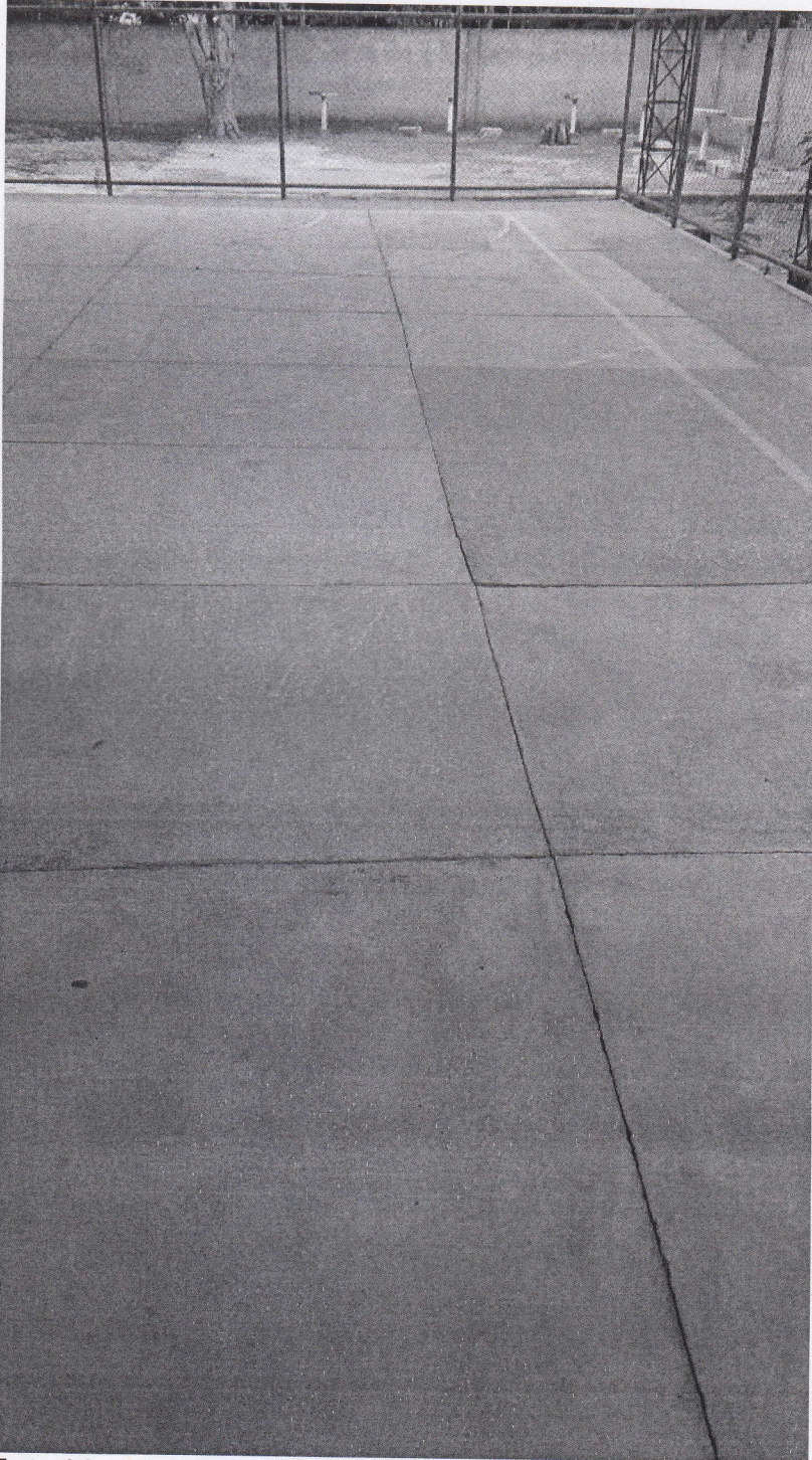
Foto 01 - Piso irregular, com ressaltos