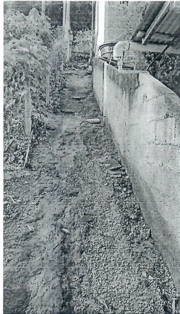
1 - Necessidade de intervenções na Travessa Gétulio Ferreira de Paula, no bairro Vila Nova.