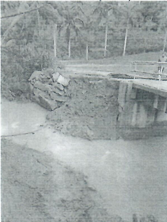
2 - Vista da cabeceira da ponte cedendo.