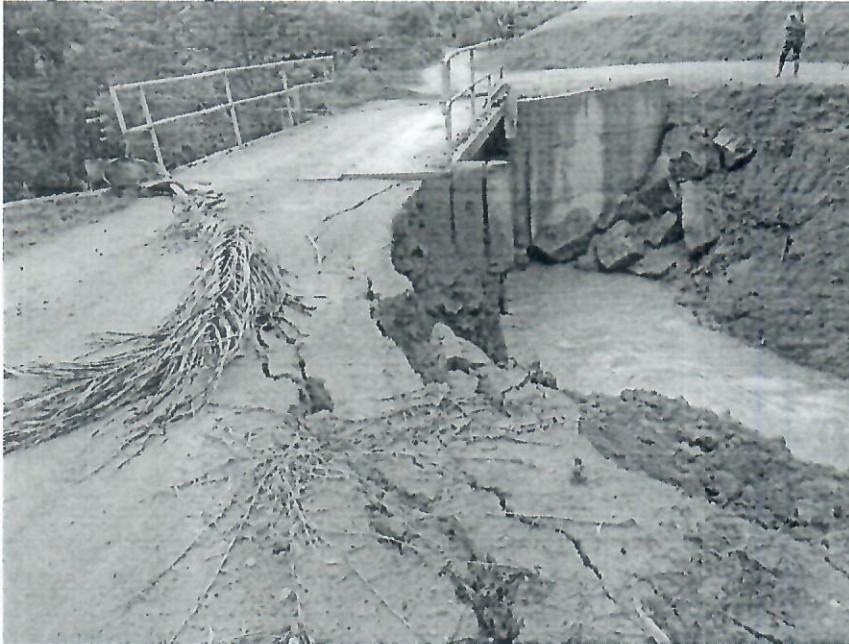
1 - Necessidade de intervenções na ponte da Comunidade de Goiapaba-Açu.