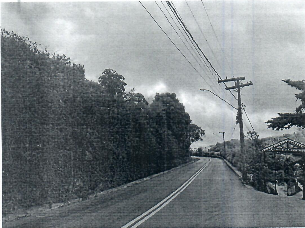
2. Rodovia ES-261 - sentido Santa Teresa x Santa Maria de Jetibá