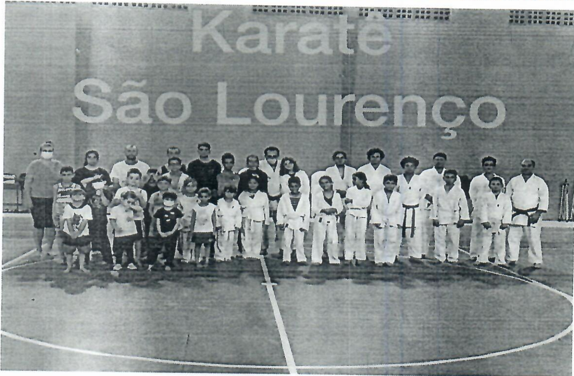
Imagens do Projeto Karate das Montanhas no Ginásio da Comunidade de São Lourenço